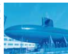
てつのくじら館

かつて東洋一の軍港と呼ばれ、あの戦艦大和を建造した呉市。大和ミュージアムには、1/10サイズとはいえ精密に再現された「戦艦大和」や本物の「ゼロ戦」、特攻兵器「回天」などが展示されています。隣接する「てつのくじら館」は実物の巨大潜水艦を陸揚げした博物館。潜水艦の機能や乗員の艦内生活にふれることができます。また、日本で唯一、海上自衛隊の潜水艦や護衛艦を間近で見ることができるのが海沿いの公園「アレイからすこじま」。周辺には、魚雷積載用のクレーンや戦時中の突堤が残り、赤レンガ倉庫が当時の佇まいを見せています。