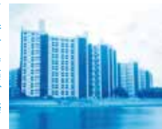
基町高層アパート

1945年、原爆投下により焼け野原となってしまった広島市には、急造の簡素な公営住宅や人々が建てたバラックが建ち並んでいました。今も残る基町のアパート群は、復興の妨げとなるこの原爆スラムを改善するために計画されました。中でも大高正人氏設計による「基町高層アパート」は、広島戦後復興に欠かす事のできない見事な建築物です。そのほか、村野藤吾氏による世界平和記念聖堂や美術館設計の第一人者谷口吉生氏が手がけた広島市環境局中工場など、広島建築デザインを建築家と建築士のガイドでディープに巡る、他では体験できないツアーです。