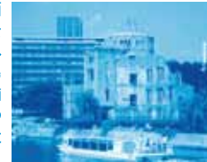
世界遺産航路

まずは、一目の世界遺産、原爆ドーム前より乗船。広島街並みを川面から眺めながらいくつもの橋をくぐり宮島へ移動します。2つの世界遺産を水路で結ぶ広島ならではの海上交通船です。宮島上陸後は、もみじまんじゅう店やお土産店が軒を連ねる参道を歩いて、二つ目の世界遺産、厳島神社へ。海上に建つ寝殿造りの社は荘厳華麗な美しさです。昼食は老舗旅館「岩惣」で穴子重をご堪能ください。午後は自由行動ですが、同行の広島地区会員が町家通りのギャラリー・カフェなどにご案内します。ゆっくりと日本三景宮島の散策をお楽しみください。お帰りは自由解散となります。